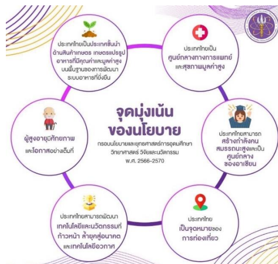
ภาพที่ 10 จุดมุ่งเน้นของนโยบายกรอบนโยบายและยุทธศาสตร์การอุดมศึกษา วิทยาศาสตร์ วิจัยและนวัตกรรม