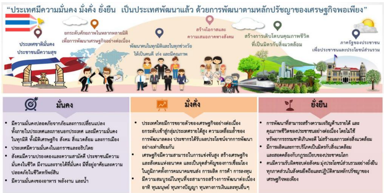
ภาพที่ 8 กรอบแผนยุทธศาสตร์ชาติ

เป้าหมายการพัฒนาประเทศ คือ “ประเทศชาติมั่นคง ประชาชนมีความสุข เศรษฐกิจพัฒนาอย่างต่อเนื่อง สังคมเป็นธรรม ฐานทรัพยากรธรรมชาติยั่งยืน” โดยยกระดับศักยภาพของประเทศในหลากหลายมิติ พัฒนาคมนในทุกมิติและในทุกช่วงวัยให้เป็นคนดี เก่ง และมีคุณภาพ สร้างโอกาสและความเสมอภาคทางสังคม สร้างการเติบโตบนคุณภาพชีวิตที่เป็นมิตรกับสิ่งแวดล้อม และมีภาครัฐของประชาชนเพื่อประชาชนและประโยชน์ส่วนรวม โดยการประเมินผลการพัฒนาตามยุทธศาสตร์ชาติ