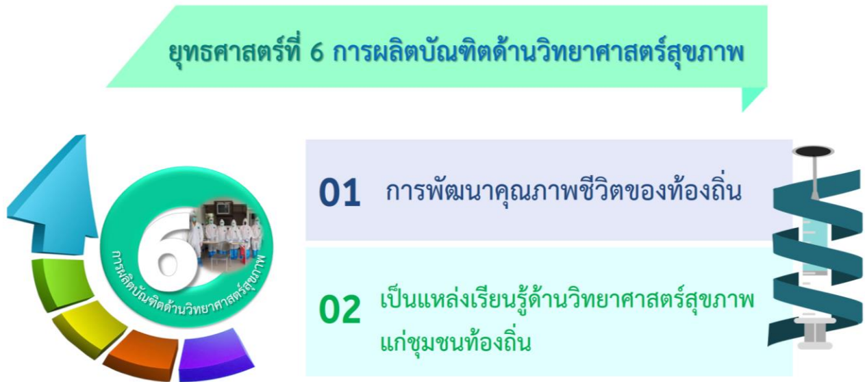
ภาพที่ 7 ยุทธศาสตร์ที่ 6 การผลิตบัณฑิตด้านวิทยาศาสตร์สุขภาพ และความสอดคล้องของเป้าประสงค์

มหาวิทยาลัยราชภัฏร้อยเอ็ด ตระหนักและเล็งเห็นถึงคุณภาพชีวิตและสุขภาพอนามัยของประชากรในปัจจุบัน จึงจำเป็นต้องผลิตบัณฑิตด้านวิทยาศาสตร์สุขภาพเพิ่มมากขึ้น เพื่อให้สามารถกระจายไปสู่ระดับท้องถิ่น ชุมชนได้สัดส่วนที่เหมาะสมและสอดคล้องกับแผนพัฒนาเศรษฐกิจและสังคมแห่งชาติ ฉบับที่ 13 พ.ศ. 2566 - 2570 ภายใต้วิสัยทัศน์ “มุ่งพัฒนาผู้เรียนให้มีความรู้คู่คุณธรรม มีคุณภาพชีวิตที่ดี มีความสุขในสังคม”