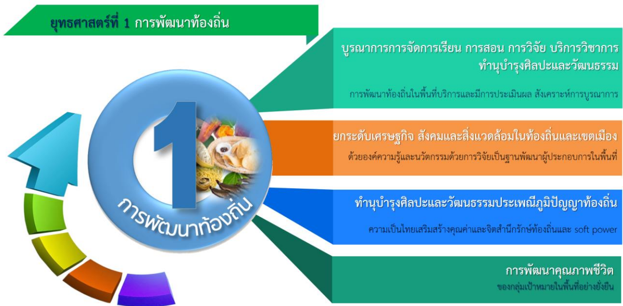
ภาพที่ 2 ยุทธศาสตร์ที่ 1 การพัฒนาท้องถิ่น และความสอดคล้องของเป้าประสงค์

มหาวิทยาลัยราชภัฏร้อยเอ็ด มุ่งการบูรณาการการบริการวิชาการกับการเรียนการสอน การวิจัยและการผลิตบัณฑิตที่เชื่อมโยงภูมิปัญญาในระดับท้องถิ่นระดับชาติและระดับสากล นำองค์ความรู้ที่มีความหลากหลายทางวิชาการไปพัฒนาชุมชนเสริมสร้างความเข้มแข็งของผู้นำชุมชนและท้องถิ่น โดยมีการประสานความร่วมมือและช่วยเหลือเกื้อกูลกันระหว่างมหาวิทยาลัย ชุมชน พัฒนาความรู้ด้านการประกอบอาชีพ เพื่อสร้างรายได้ให้กับชุมชนผ่านการพัฒนาศักยภาพด้านสินค้าและบริการ พัฒนาชุมชนให้เป็นแหล่งท่องเที่ยวเชิงวัฒนธรรม