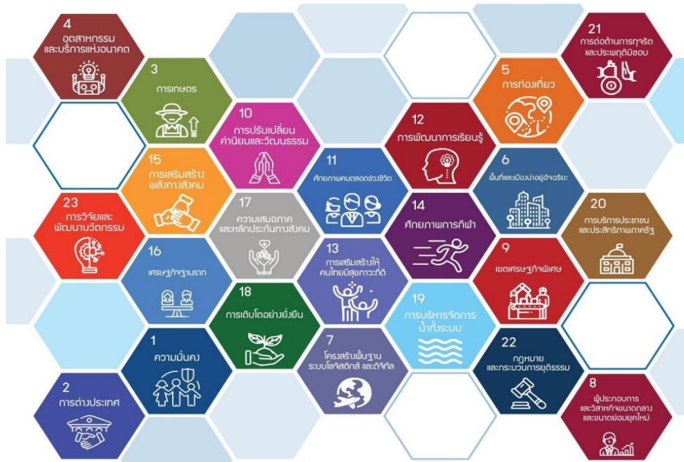
ภาพที่ 9 แผนแม่บท 23 ประเด็น