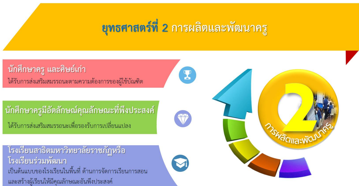
ภาพที่ 3 ยุทธศาสตร์ที่ 2 การผลิตและพัฒนาครู และความสอดคล้องของเป้าประสงค์

มหาวิทยาลัยราชภัฏร้อยเอ็ด มุ่งบูรณาการการผลิตบัณฑิตครูศาสตร์แบบสหวิทยาการและเสริมสร้างสมรรถนะและทักษะ เพื่อการพัฒนากระบวนการผลิตครูให้มีความสมดุลทั้งคุณภาพและคุณธรรม เพื่อเป็นต้นแบบครูเพื่อศิษย์ตลอดจนพัฒนาวัดกรรมการศึกษาศึกษาต่อบ้จกัศกษาของลกอนาคตร่วมกับภาคีเครือข่ายที่เกี่ยวข้อง เพื่อนำไปสู่การเป็นนักพัฒนาและนวัตกรรมที่มีทัศนคติที่ดีมีอัตลักษณ์ และความโดดเด่นหลากหลายสอดคล้องกับ ความต้องการบุคลากรครูของท้องถิ่นและประเทศ และมีมาตรฐานระดับสากลพร้อมยกระดับความก้าวหน้าทางวิชาชีพครู ของบัณฑิตครูราชภัฏอย่างต่อเนื่อง เพื่อความมั่นคงทางเศรษฐกิจและสังคมตามหลักปรัชญาเศรษฐกิจพอเพียง