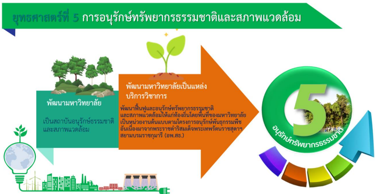
ภาพที่ 6 ยุทธศาสตร์ที่ 5 การอนุรักษ์ทรัพยากรธรรมชาติและสภาพแวดล้อม และความสอดคล้องของเป้าประสงค์

มหาวิทยาลัยราชภัฏร้อยเอ็ด มุ่งเน้นการใช้ทรัพยากรธรรมชาติและสภาพแวดล้อมอย่างฉลาดโดยใช้น้อย เพื่อให้เกิดประโยชน์สูงสุดโดยคำนึงถึงระยะเวลาในการใช้ให้ยาวนานและก่อให้เกิดผลเสียต่อสภาพแวดล้อมน้อยที่สุด รวมทั้งต้องมีการกระจายการใช้ทรัพยากรธรรมชาติอย่างทั่วถึง โดยทำการพัฒนาภูมิทัศน์และสภาพแวดล้อมให้ร่มรื่น น่าอยู่ น่าเรียนมีบรรยากาศทางวิชาการ สร้างความรัก ความสามัคคี สร้างสุขภาวะที่ดี เพื่อให้นักศึกษาและบุคลากรทุกคนมีความสุข อบอุ่น และปลอดภัยและในปี 2566 ให้ได้รับรางวัลมหาวิทยาลัยสีเขียว (Green University) บริการวิชาการเพื่อพัฒนาฟื้นฟูและอนุรักษ์ทรัพยากรธรรมชาติและสภาพแวดล้อมให้แก่ชุมชน และท้องถิ่นโดยดำเนินการให้พื้นที่ของมหาวิทยาลัยเป็นองค์กรแห่งการเรียนรู้และเป็นหน่วยงานต้นแบบตามโครงการอนุรักษ์พันธุกรรมพืชอันเนื่องมาจากพระราชดำริสมเด็จพระเทพรัตนราชสุดาฯ สยามบรมราชกุมารี (อพ.สธ.)