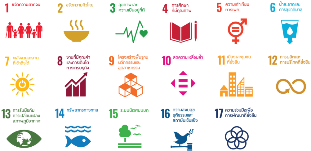
ภาพที่ 11 เป้าหมายการพัฒนาที่ยั่งยืน (Sustainable Development Goals – SDGs)