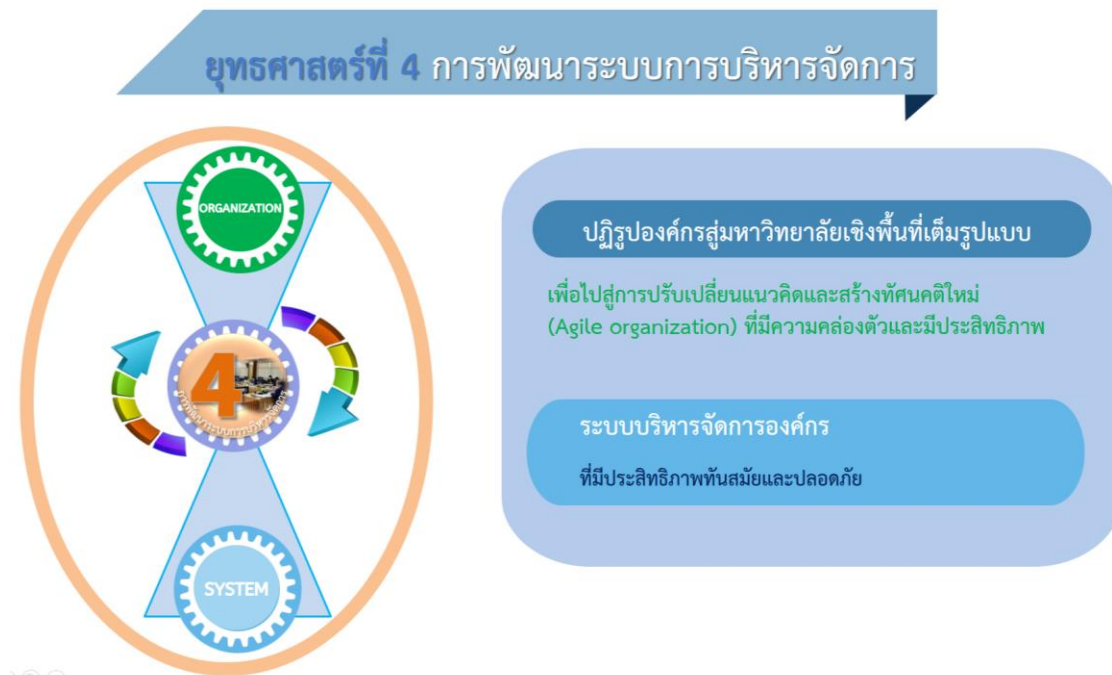
ภาพที่ 5 ยุทธศาสตร์ที่ 4 การพัฒนาระบบการบริหารจัดการ และความสอดคล้องของเป้าประสงค์

มหาวิทยาลัยราชภัฏร้อยเอ็ด มุ่งเน้นและให้ความสำคัญหลักการบริหารจัดการองค์กรที่ดีใช้หลักธรรมาภิบาลควบคู่กับ เน็กซ์ โมเดล (NEXTS Model) ปรับปรุงและพัฒนาองค์กรสู่ดิจิทัลและมหาวิทยาลัยสีเขียว (Digital organization & Green university) และพัฒนาบุคลากรให้เป็นผู้ดำเนินการเปลี่ยนแปลงมีการปรับเปลี่ยนแนวคิดและสร้างทัศนคติใหม่ (Agile learner) พร้อมทำงานเชิงรุก รวมทั้งจัดทำระบบสวัสดิการเพื่อสนับสนุนกิจการของมหาวิทยาลัย เน้นการสร้างเครือข่ายเพื่อการพัฒนาทางด้านต่าง ๆ เป็นสถาบันการศึกษาเพื่อการพัฒนาท้องถิ่น พัฒนาศูนย์ข้อมูลและระบบสารสนเทศที่มีประสิทธิภาพและทันสมัย ส่งเสริม สนับสนุนนักศึกษาและบุคลากรให้เข้าถึงระบบข้อมูลและสารสนเทศอย่างครอบคลุมทุกพื้นที่และอย่างมีประสิทธิภาพ