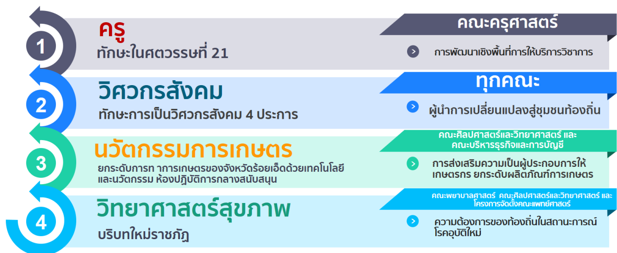
ภาพที่ 1 นโยบายผู้บริหารมหาวิทยาลัยราชภัฏร้อยเอ็ด (NEXTS)